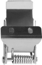
4058075409859 Einbauklemmen für Panel-Leuchten