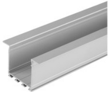
4058075278134 Weite Profile für LED-Bänder