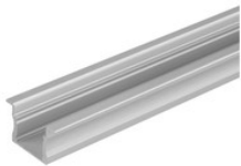
4058075278400 Medium Profile für LED-Bänder