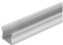
4058075279278 Medium Profile für LED-Bänder