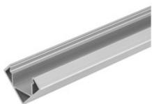
4058075279308 Medium Profile für LED-Bänder