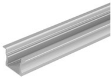
4058075278400 Medium Profile für LED-Bänder