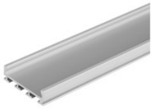
4058075278103 Weite Profile für LED-Bänder