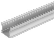
4058075279278 Medium Profile für LED-Bänder