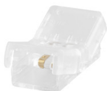
4058075727557 Verbinder für LED-Bänder