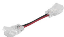
4058075727496 Verbinder für LED-Bänder