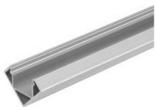
4058075279308 Medium Profile für LED-Bänder