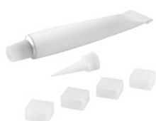
4058075727649 Verbinder für LED-Bänder