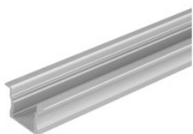
4058075401747 Medium Profile für LED-Bänder