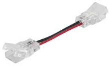
4058075727496 Verbinder für LED-Bänder