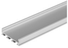
4058075278103 Weite Profile für LED-Bänder