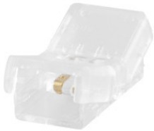
4058075727557 Verbinder für LED-Bänder