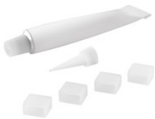
4058075727649 Verbinder für LED-Bänder