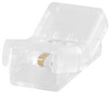
4058075727557 Verbinder für LED-Bänder