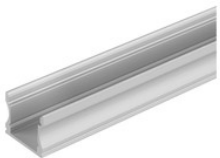
4058075279278 Medium Profile für LED-Bänder