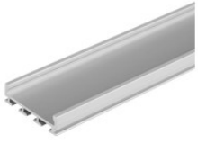
4058075278103 Weite Profile für LED-Bänder