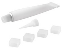
4058075727649 Verbinder für LED-Bänder