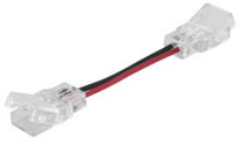
4058075727496 Verbinder für LED-Bänder