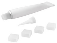
4058075727649 Verbinder für LED-Bänder