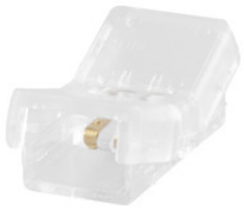
4058075727557 Verbinder für LED-Bänder