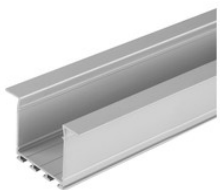
4058075401471 Weite Profile für LED-Bänder