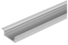
4058075401594 Flache Profile für LED-Bänder