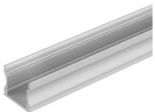
4058075279278 Medium Profile für LED-Bänder