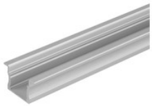
4058075278400 Medium Profile für LED-Bänder