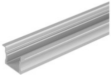
4058075401747 Medium Profile für LED-Bänder