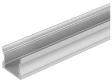
4058075401778 Medium Profile für LED-Bänder