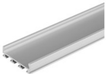
4058075401440 Weite Profile für LED-Bänder