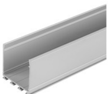
4058075401501 Weite Profile für LED-Bänder