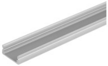
4058075401624 Flache Profile für LED-Bänder