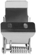
4058075409859 Einbauklemmen für Panel-Leuchten