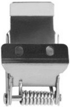
4058075409859 Einbauklemmen für Panel-Leuchten