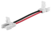
4058075727434 Verbinder für LED-Bänder