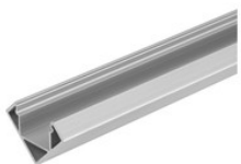
4058075279308 Medium Profile für LED-Bänder