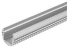
4058075278349 Medium Profile für LED-Bänder