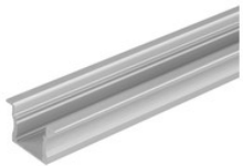
4058075278400 Medium Profile für LED-Bänder