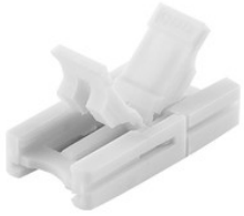
4058075727526 Verbinder für LED-Bänder