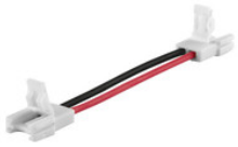
4058075727434 Verbinder für LED-Bänder