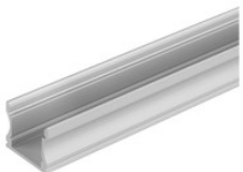
4058075279278 Medium Profile für LED-Bänder