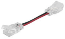
4058075727496 Verbinder für LED-Bänder