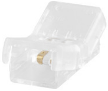
4058075727557 Verbinder für LED-Bänder