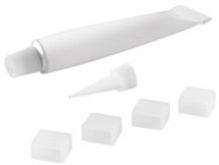
4058075727649 Verbinder für LED-Bänder