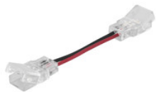
4058075727496 Verbinder für LED-Bänder