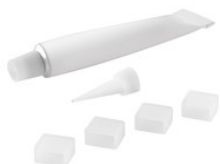
4058075727649 Verbinder für LED-Bänder