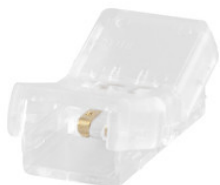
4058075727557 Verbinder für LED-Bänder